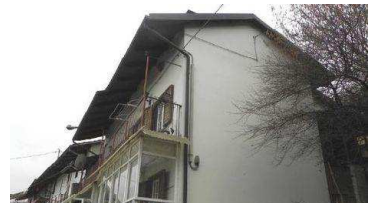
Appartamenti Cumiana Fiola - 20171

Tribunale di Torino Tribunale di Biella Tribunale di Ivrea