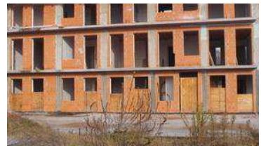
Appartamenti Oleggio Romana