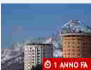
torinosportiva.it Vialattea: apertura degli impianti dal 7 dicembre