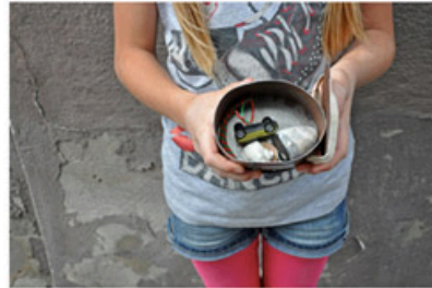
Message in a box 2011