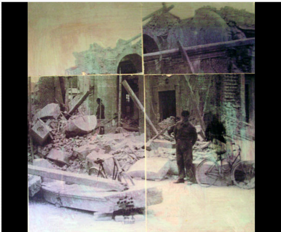
Enzo Comin - Cant_ieri Project, 2011