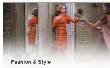
Fashion &amp; Style