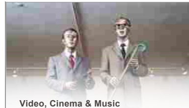
Video, Cinema & Music

You need to sign up to able to comment and interact with our community