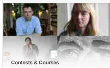
Contests &amp; Courses