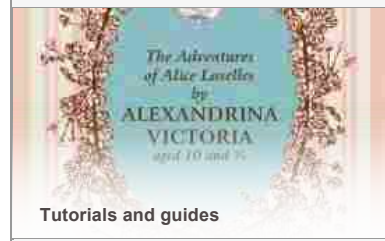
Tutorials and guides