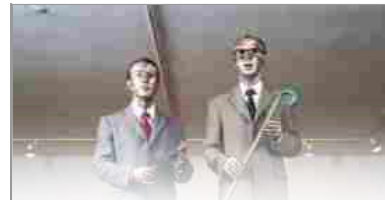
Video, Cinema & Music

Acapella, Napoli; Alfonso Artiaco, Napoli; Isabella Bortolozzi, Berlino; Bravermann Gallery, Tel Aviv; Antonio Colombo, Milano; Continua, San Gimignano, Beijing, Les Moulins, Havana; Raffaella Cortese, Milano; Guido Costa Projects, Torino; Riccardo Crespi, Milano; Monica De Cardenas, Milano; Umberto Di Marino, Napoli; Ermes-Ermes, Vienna; Renata Fabbri, Milano; Fonti, Napoli; Laveronica, Modica; Magazzino, Roma; Norma Mangione, Torino; Francesca