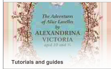
Tutorials and guides