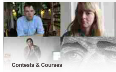
Contests & Courses