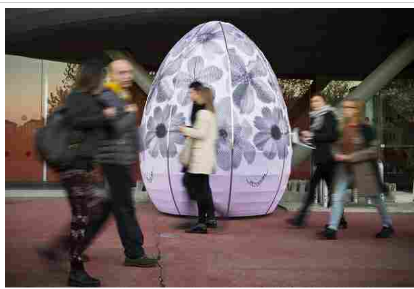
Artissima, Internazionale d'arte contemporanea2016

"Deposito d'Arte Italiana Presente" è il progetto espositivo della fiera curato da Ilaria Bonacossa e Vittoria Martini, dedicato all'arte italiana