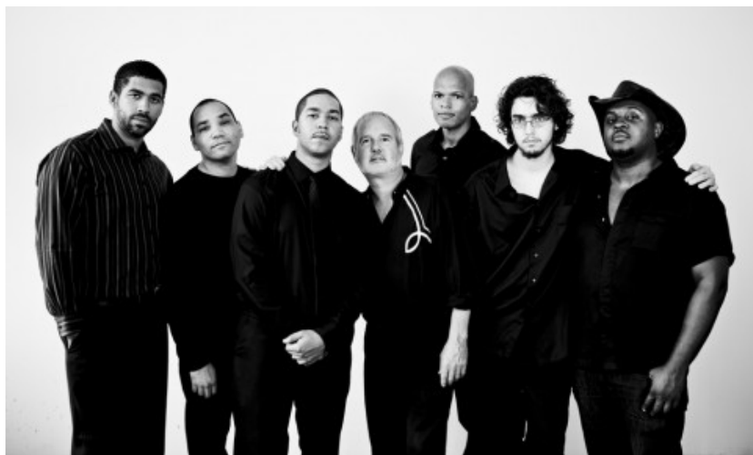
Tim Rollins & KOS

Partiamo dall’inizio. Rollins & Kos nasce di fatto nel 1982, quando ti viene proposto un periodo di insegnamento alla Public School 52 nel South Bronx di New York, frequentata soprattutto da ragazzi provenienti da contesti problematici. I risultati