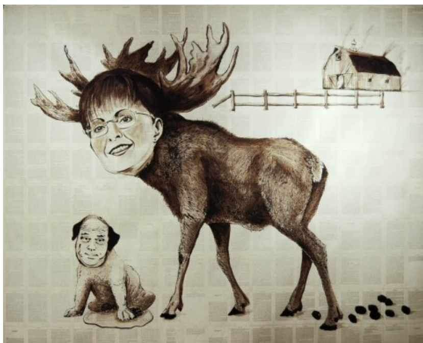
Tim Rollins & KOS – The River. Meander I (after Edward "Duke" Ellington) (detail) – 2011 – Courtesy the artist and Lehmann Maupin Gallery, New York

Io e i Kos ci siamo ispirati tantissimo ai modelli pedagogici italiani... Gramsci prima di tutto, poi Montessori, Bruno Munari e il grande, grande Enzo Mari. La nostra sfida è capire come possono l'arte e il design – al servizio della didattica – creare ciò che Martin Luther King definiva come una comunità amorevole, una famiglia formata attraverso la creazione artistica. I Kos non sono gli assistenti di una grande ideologia maestra. Invece, cerchiamo di realizzare una democrazia organica – come il jazz americano o la musica gospel – "improvvisazionale", imprevedibile... Qualcosa che scorre come un fiume: mutevole seppure sempre identificabile come arte. La democrazia che si manifesta attraverso la materia visiva.