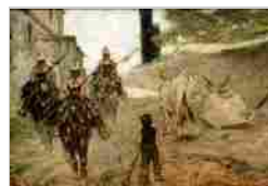
PATTUGLIA DI CAVALLEGGERI GIOVANNI FATTORI RACCOLTE FRUGONE VILLA GRIMALDI FASSIO