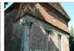
CHIESA DI SANT'URBANO ALLA CAFFARELLA ROMA