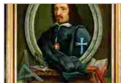
FRANCESCO CASTELLI BRUMINO (FRANCESCO BORROMINI)